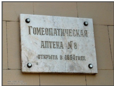
Рис. 1. Гомеопатична аптека.