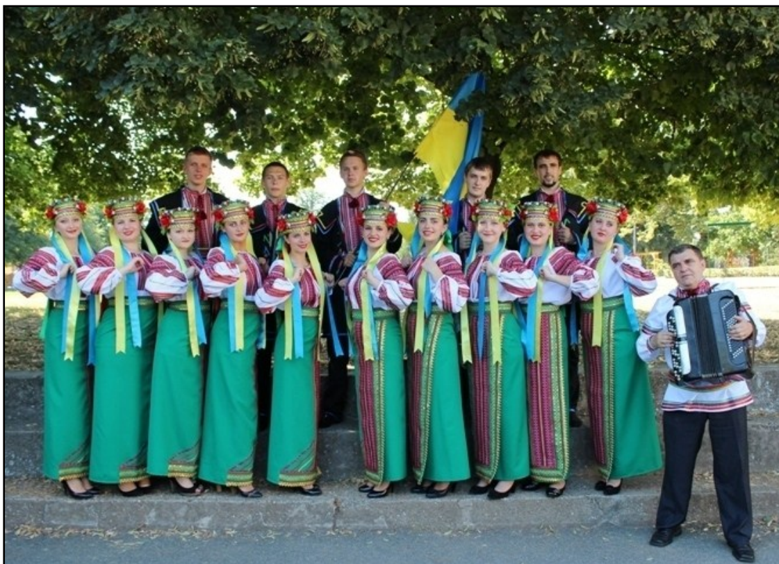
Фото 6. Народний аматорський ансамбль пісні і танцю “Трембіта” став учасником фестивалю “Буковинські зустрічі” (2013).