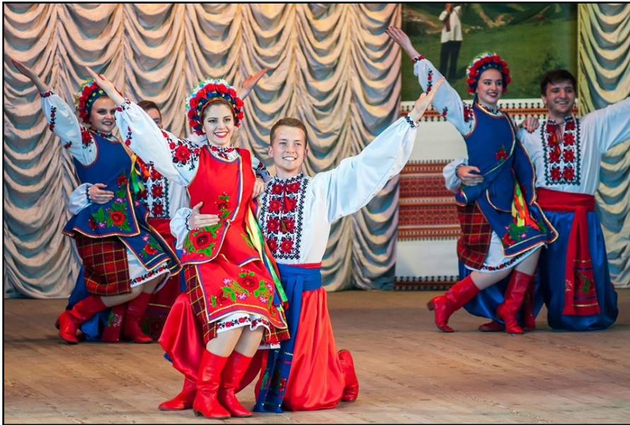
Фото 8–9. Хореографічна група ансамблю “Трембіта” (2018 р.).