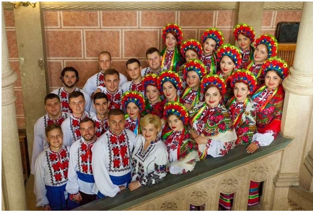
Фото 11. Ансамбль "Трембіта" БДМУ Лауреат I ступеня Міжнародного вокально-хорового конкурсу-фестивалю "Хай пісня скликає друзів" (2019 р.). Новини на інтернет-ресурсі www.karpaty.news

Аматорська діяльність студентської молоді університету сприяє підвищенню "особистого статусу", задоволення потреб індивідуального престижу, тобто стати широко освіченою, інтелектуально розвинутою, духовно збагаченою людиною з яскраво вираженою «Я-концепцією».