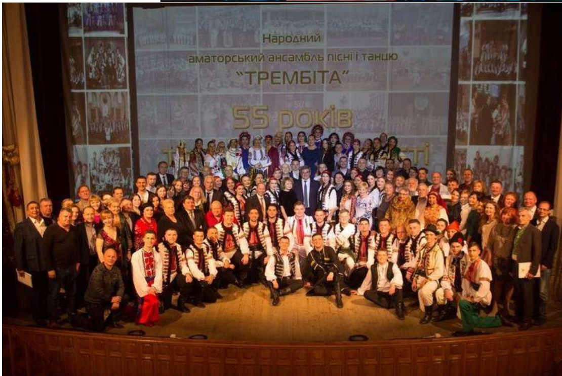
Фото 10. 55-річчя творчої діяльності ансамблю “Трембіта” (2018 р.).