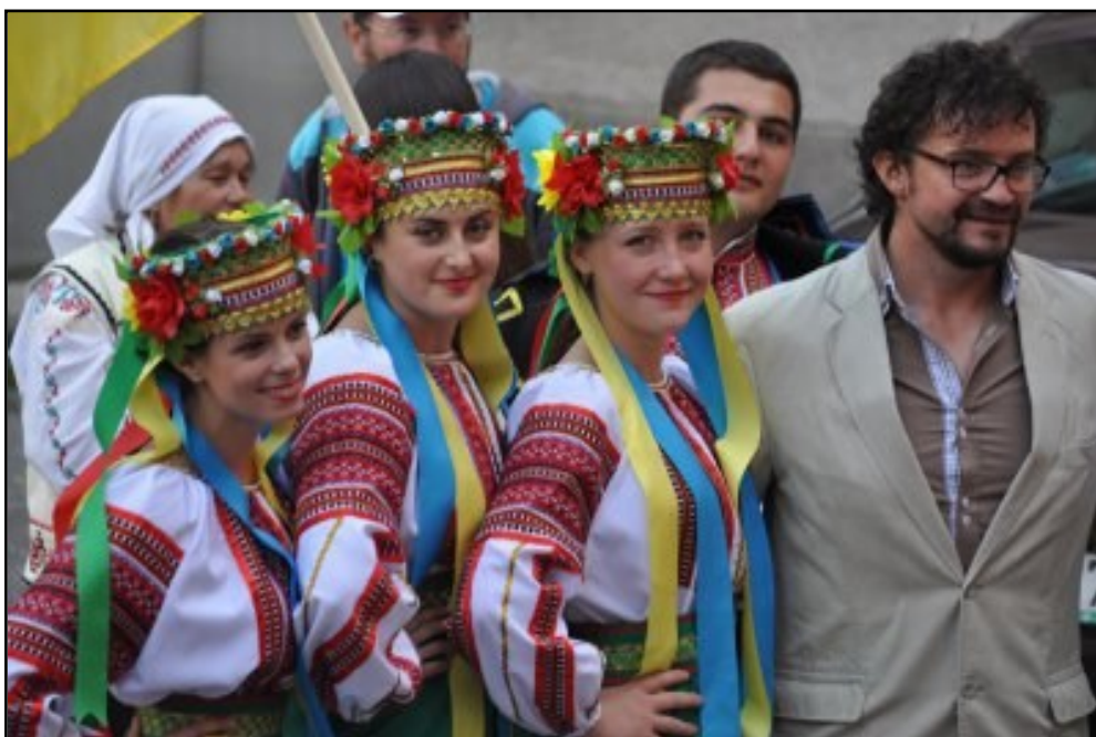
Фото 7. Повернення ансамблю БДМУ зі Словаччини (22-24.08.2014).