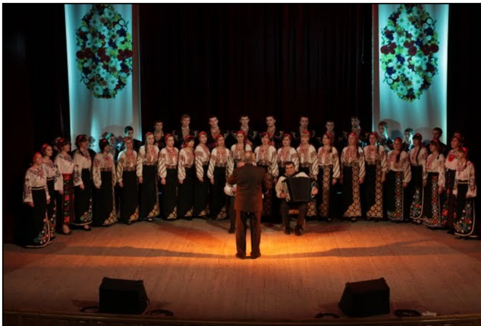
Фото. 5. Святкування з нагоди підтвердження звання «Народного аматорського ансамблю», 26.12.2011 р. Офіційний сайт БДМУ ( www.bsmu.edu.ua )