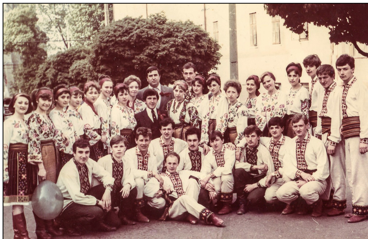
Фото. 4. Колектив ансамблю "Трембіта" у 1980-х рр.