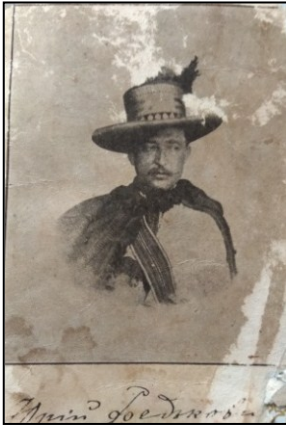
Лірник Юрій Федькович