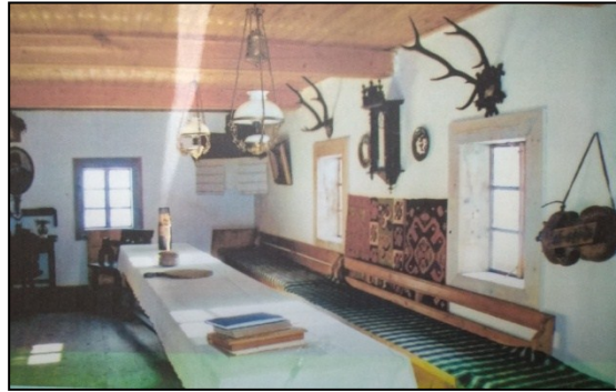
Світлиця хати Ю.Федьковича, на стіні якої висить ліра. селище Путила.