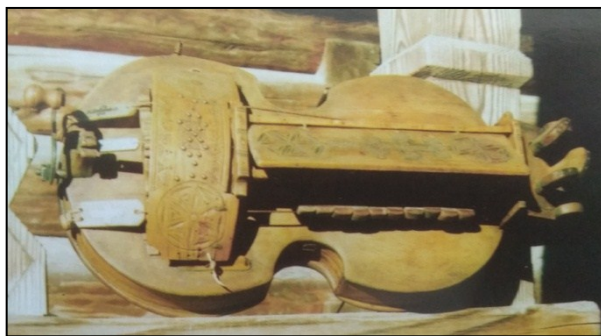
Ліра з музею Юрія Федьковича, яка належала лірнику Д.Генцарю 1920р. селище Путила