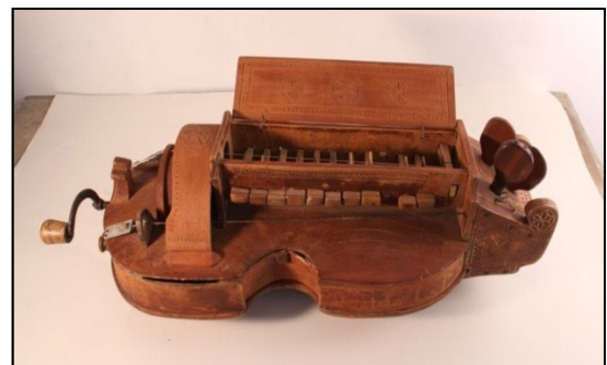
Ліра роботи невідомого майстра, що належала лірнику Д.Генцарю Чернівецька область, с. Путила. МНАПУ.