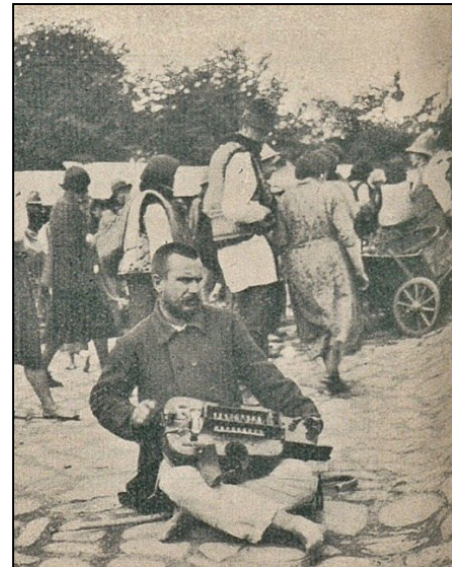
Сліпий лірник с.Кути 1931р. Фото з газети «Діло» 1931р.